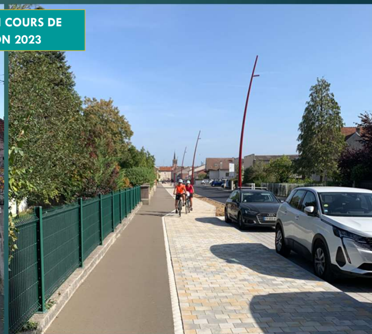
Coupe de principe stationnements drainants